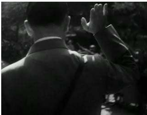
Anexo 4 – Contra-campo