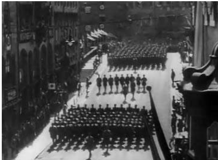
Anexo 14 – Planos aéreos