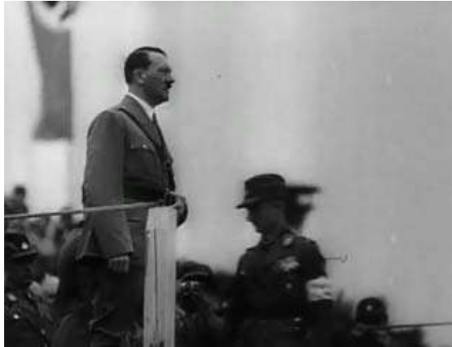
Anexo 6 – Plano contrapicado de Hitler