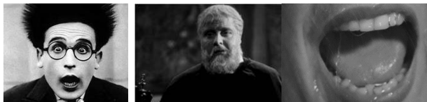
Anexo 2 – Plano Grande, Plano Aproximado, Plano de Pormenor