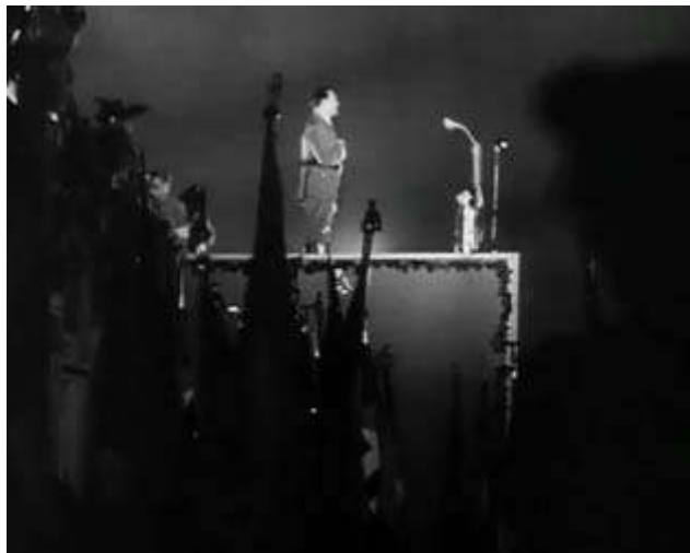
Anexo 10 – Hitler elevado (plano contrapicado), iluminação apenas no palco, multidões em silhueta