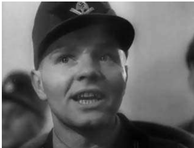
Anexo 7 – Grande plano “felicidade artificial”