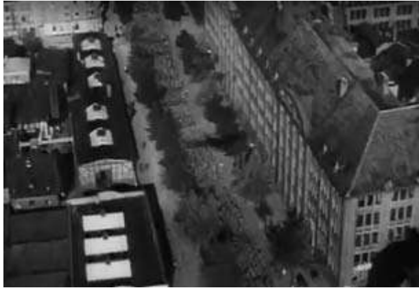
Anexo 4 – A sombra do avião lançada sobre a cidade