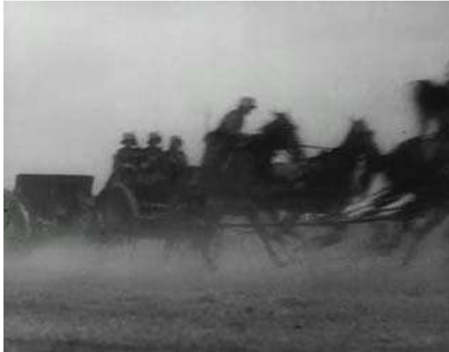
Anexo 9 – Plano contrapicado da força militar