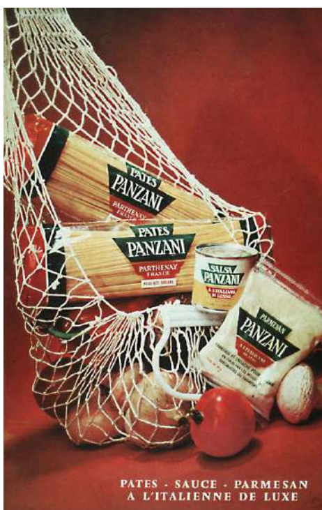
Anexo 1 – Anúncio publicitário que Roland Barthes analisa no seu texto “Retórica da imagem”