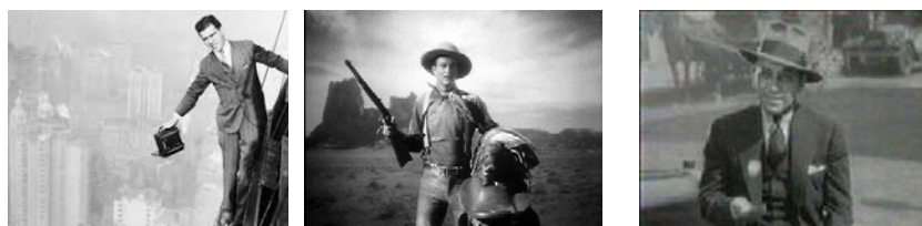
Anexo 3 – Plano geral, Plano americano, Plano médio