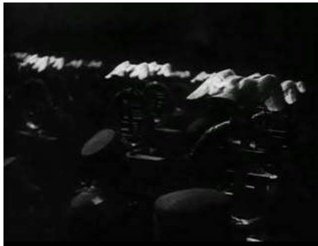
Anexo 5 – Padrão de simbologia nazi