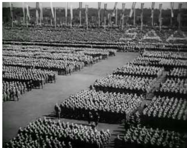
Anexo 8 – Plano aéreo, organização militar