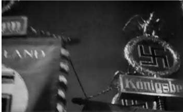
Anexo 15 – simbologia nazi