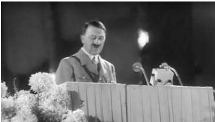
Anexo 16 – Plano contrapicado durante o discurso